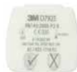
D7925 P2 R