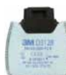
D3128 P2 R/ határérték alatti szerves gőzök és savas gázok