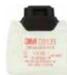
D3135 P3 R