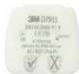
D7915 P1 R