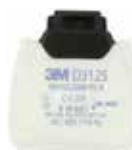
D3125 P2 R