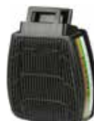
D8094 ABEK P3 R