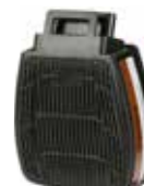
D8095 A2 P3 R