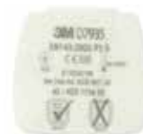
D7935 P3 R