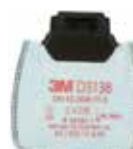
D3138 P3 R/ határérték alatti szerves gőzök és savas gázok