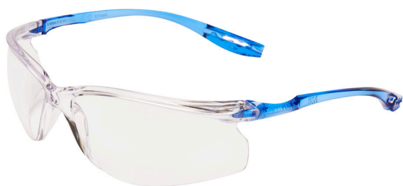
71511-00000 Lencse: Víztisza