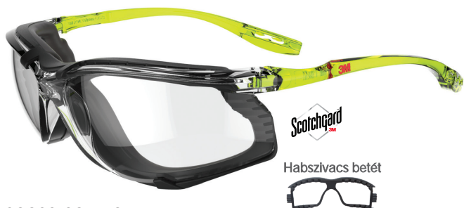
SCCS01SGAF-GRN-F Lencse: Víztisza