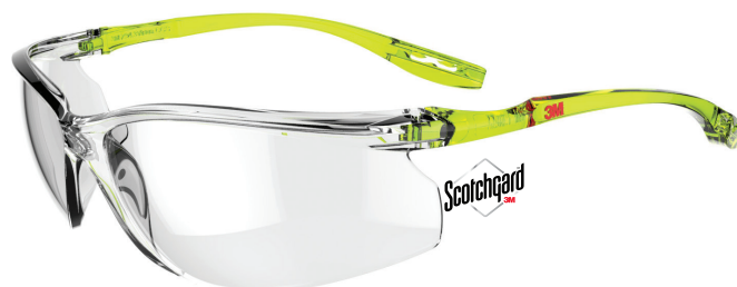
SCCS01SGAF-GRN Lencse: Víztisza