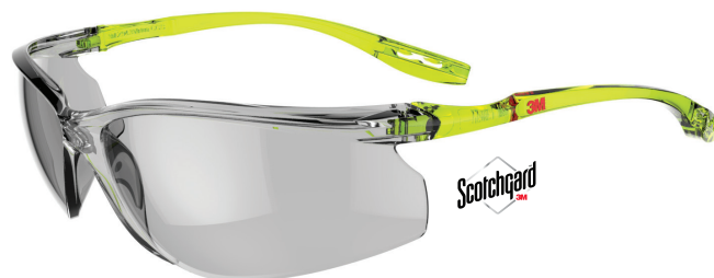
SCCS07SGAF-GRN Lencse: I/O szürke