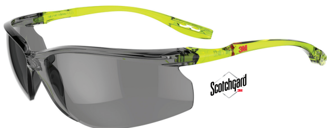
SCCS02SGAF-GRN Lencse: Szürke